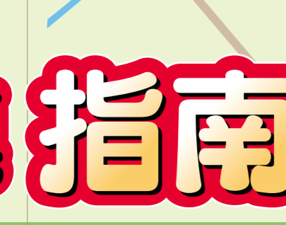
三種鎮 綠色PIA 三種鎮鄉村資源情報中心

由日本第二大湖八郎瀨排水整地而成的八郎湖是釣魚的好地方，吸引著來自各地的釣魚遊客，非常熱鬧。