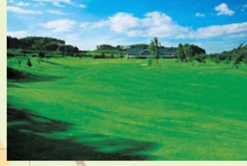
秋田森岳溫泉36高爾夫球場 D-3

石倉山公園鄰接的森岳溫泉36高爾夫球場是東北地區最大規模的，雄大而充滿自然風光的球場具有超人的魅力。