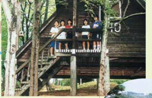
石倉山公園野營場 D-3

在高143m的石倉山，野營場、野營車等設施齊全，對喜歡野外宿營的人那兒是非常理想的自然公園。